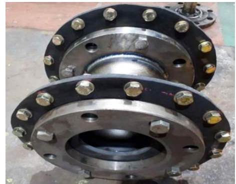
<해수 흡입관 청소장치의 실제 사진>